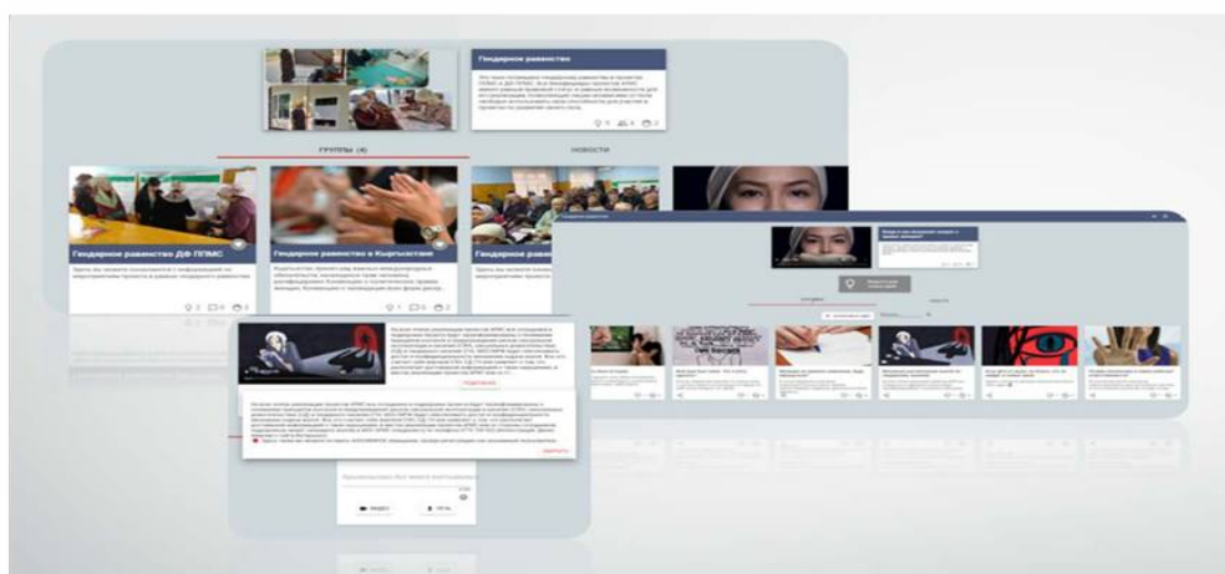
Рисунок 7. Окна по обратной связи по теме ГН