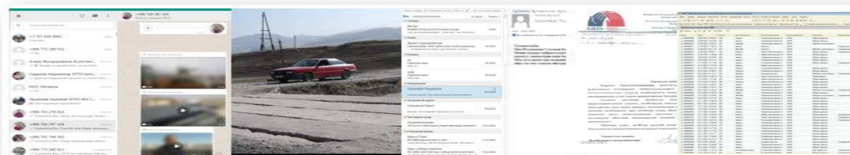
Рисунок 2. Обращение поступившие по каналам МОС (видео, ватсап, почта, нарочно)

По телефону и ватсап МОС обратилось 247 бенефициаров, что составляет 63% от общего числа обращений, данный канал МОС по приему обращений является самым удобным и эффективным как для бенефициара так и для специалистов МОС АРИС, данный канал позволяет получить более расширенную информацию в виде видео и фото сообщений и ускоряет процесс предоставления более точного и исчерпывающего ответа.