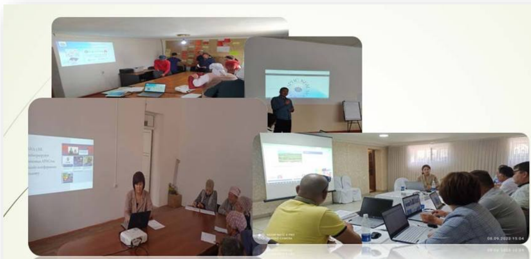
Рисунок 6. Проведение тренингов в рамках ДФ ПСИ-3